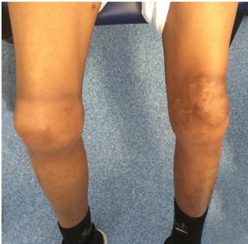
Figura 2 Artropatia bilateral dos joelhos.

familiares havia referência a três sobrinhos e um irmão (que faleceu por hemorragia intracraniana aos 15 anos), com o diagnóstico de hemofilia A grave (figura 1).