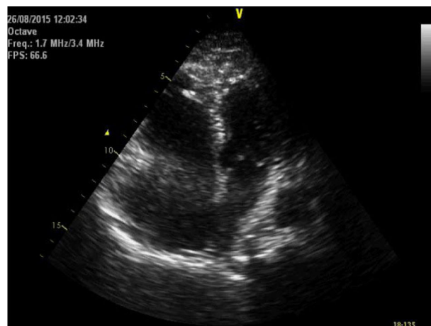
Figura 2 Apical 4 câmaras feito no Serviço de Urgência demonstra dilatação do ventrículo direito.

terapêutica fibrinolítica com tenecteplase (45 mg) e suporte aminérgico com noradrenalina.