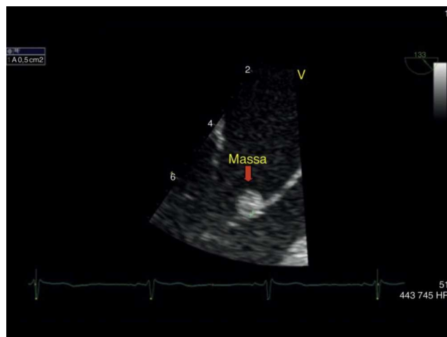
Figura 3 Ecocardiograma transesofágico em corte longitudinal com ampliação da zona de interesse com a massa ecodensa, de 0,5 cm 2 aderente ao folheto anterior da válvula mitral. AE: aurícula esquerda; VE: ventrículo esquerdo.