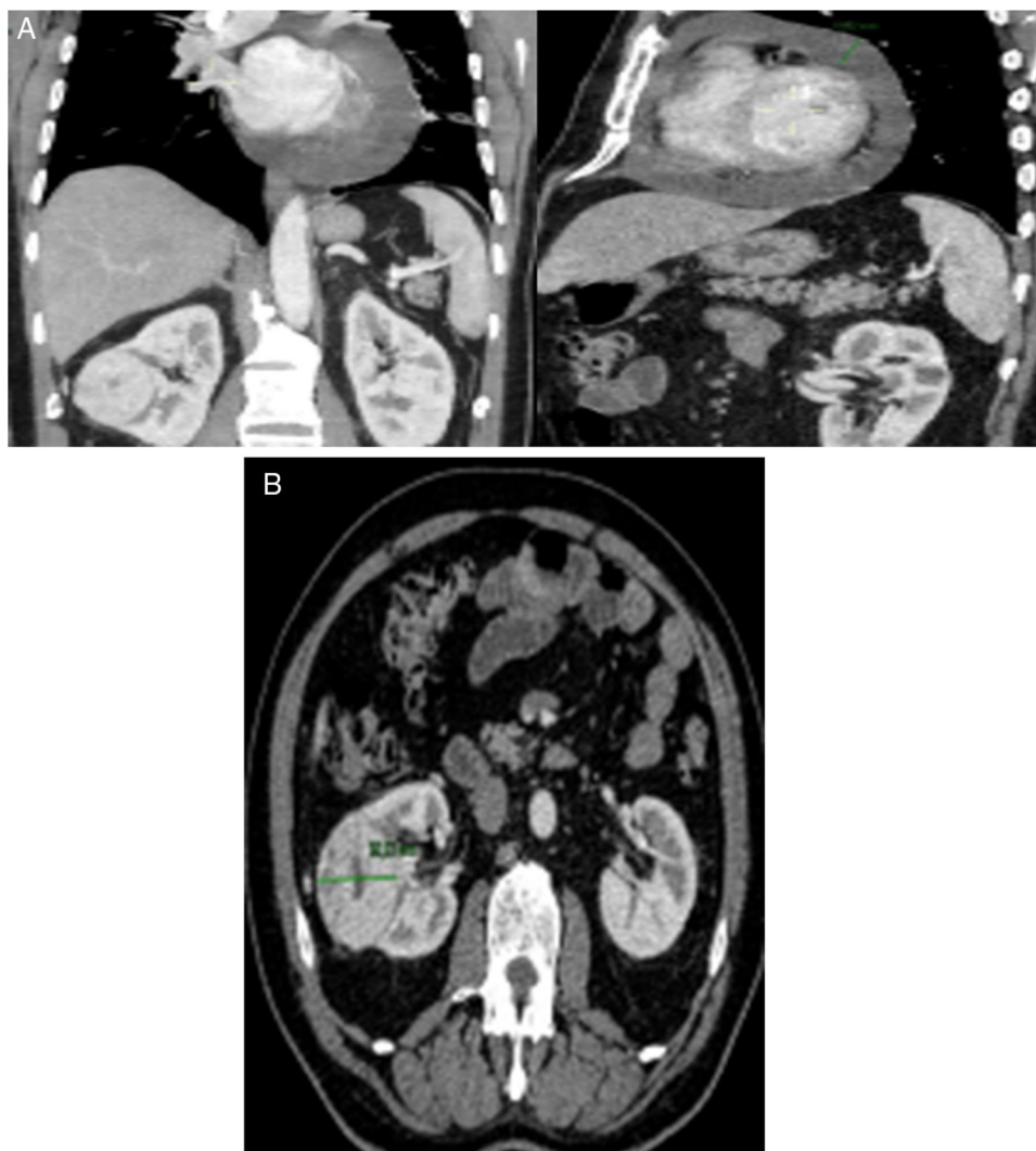
Figura 3 Imagens da TC toraco-abdomino-pélvica que mostra a existência de uma lesão captante de contraste a nível da aurícula direita (A) e uma lesão nodular sólida a nível do rim direito (B).

das cavidades direitas, com frequência no contexto de disseminação hematogênea através da veia cava inferior, ou um envolvimento concomitante das cavidades esquerdas, que resulta de uma disseminação linfática (através dos nódulos linfáticos carinais e paraesternais) 13 . A juntar a este dado, sabe-se que a presença de envolvimento cardíaco na ausência de trombos na veia cava inferior é ainda mais rara 14 . Foi a conjugação de todos estes factos que nos levou a submeter o doente a biópsia da massa cardíaca, pois a probabilidade de se tratar de uma outra neoplasia era muito elevada.