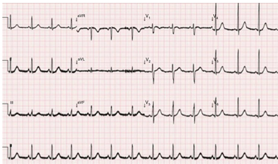
Figura 2 Eletrocardiograma 15 h após a entrada no serviço de urgência.

dos marcadores de necrose miocárdica e normalização do NT-ProBNP (Tabela 1). Gasimetria em ar ambiente pH 7,436, p\text{CO}_2 35 mmHg, p\text{O}_2 120 mmHg, COHb 0,5%, \text{HCO}_3^- 23 mmol/L.