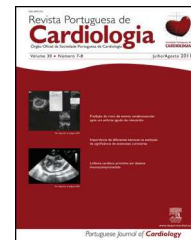
IMAGEM EM CARDIOLOGIA